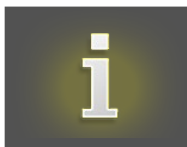
TABLEAU DES GAINS

Vue des règles du jeu et des prix à gagner pour les combinaisons de symboles gagnantes.